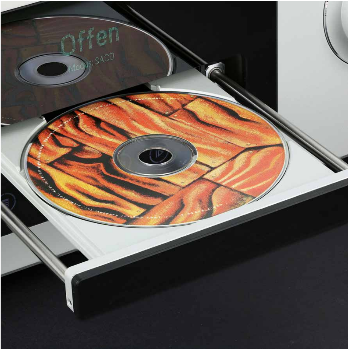
lizenziert für T+A elektroakustik | Planckstraße 9–11 | 32052 Herford | Telefon 05221 76760 | www.ta-hifi.de

Von sehr solider Machart und aus neuester T+A-Entwicklung stammend: Das eingebaute CD/SACD-Laufwerk ist mit dem allerneuesten Decoder fürs optimale Auslesen der Tonträger ausgestattet.