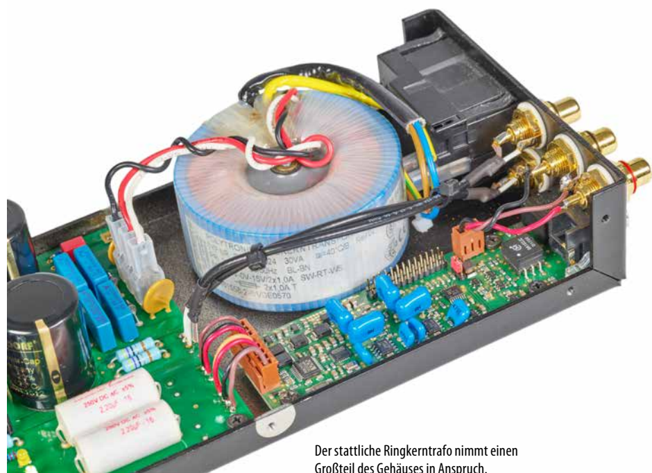
Der stattliche Ringkerntrafo nimmt einen Großteil des Gehäuses in Anspruch.

Vier gewinnt: Für die an sich konventionelle Verstärkung wählte Lehmannaudio hochwertige Operationsverstärker.